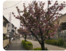
81 大庄区画第27号線 (阪神電車沿い) 武庫川町1丁目