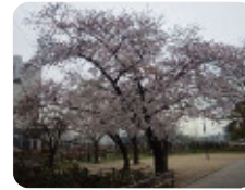
83 水明公園 水明町