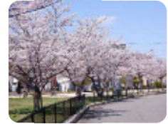
99 松島橋公園 築地1丁目4