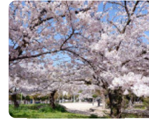
87 今福公園 今福2丁目12 サクラの広場は地域のお花見スポット。