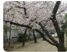
78 難波公園 東難波町4丁目3