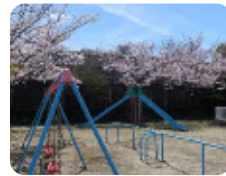
77 丸島公園 丸島町