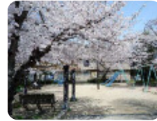
98 金楽寺公園 金楽寺町2丁目22