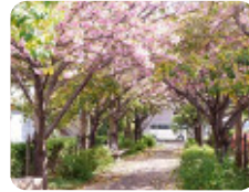
96 天神橋緑地 長洲西通2丁目7