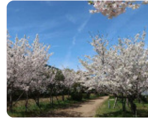
71 尼崎の森中央緑地 扇町 まだ若いサクラが多いですが家族連れで楽しめます。