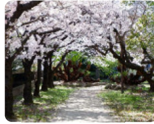
86 大物公園 東大物町1丁目1 園内にDS1(蒸気機関車)もある公園。