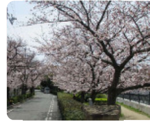
74 市道第103号線 (蓬川緑地沿い) 昭和通9丁目 蓬川緑地と一体となったサクラロード。