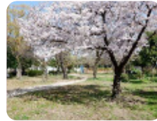
92 大物川緑地 大物町1丁目19