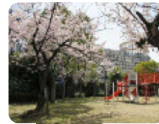
79 琴浦橋公園 南竹谷町3丁目