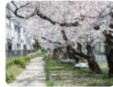
94 常光寺川西緑地 長洲東通2丁目5