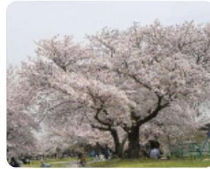
73 武庫川河川敷緑地 大庄西町1丁目 付近 阪神武庫川駅の北側は毎年多くの人で賑わいます。