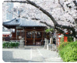
89 桜井神社 南城内 尼崎藩主を祭る神社で、春にサクラが咲き誇ります。