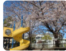
82 西向島公園 西向島町