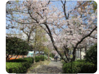
75 祇園橋緑地 元浜町1丁目 他 約500mの緑道は尼崎運河まで続いています。