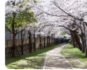
90 西大物緑地 西大物町12 阪神電車に沿って続くサクラのトンネル。