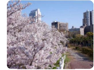
88 庄下川歩行者専用道路 西長洲町3丁目4 川沿いには遊歩道が整備されています。