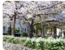
100 二の丸公園 北城内

阪神杭瀬駅前になりながら大きく緑豊かな公園で、春には桜の広場でのお花見を楽しめます。園内にはすべり台やジャングルジムなどの遊具があり、子ども達も楽しく遊べる、地域の人々に愛されている公園です。