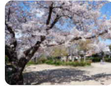
97 北浜公園 東本町4丁目 他