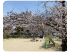
80 西駄公園 大島1丁目31