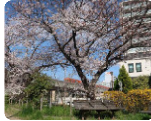
70 蓬川緑地 道意町1丁目 付近 蓬川の両岸に約1,000本のサクラのトンネルが続きます。