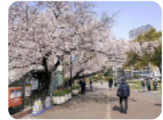
95 中央公園 神田中通1丁目他