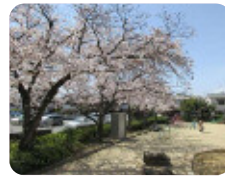
76 成文公園 大島2丁目13