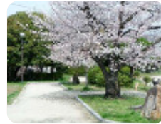
93 稲川公園 長洲中通3丁目24