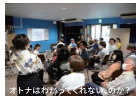
オトナはわかってくれないのか？