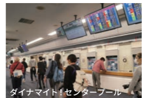
ダイナマイト！センタープール

材木店で開催した「笑うケンシン」では、4人のゲストを招き検診・健診にどうして行かせるのか、なぜ行きたくないのか、その理由をユーモアを交えながらも真剣に探りました。